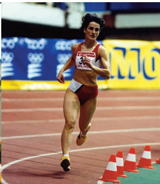
La catalana Inmaculada Clopés dominó la escena nacional en la década de los 90.