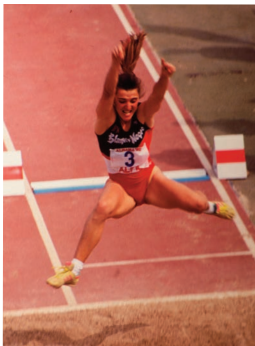
Susana Cruz, primera atleta en superar los 4.000 puntos en pentatlón (1991).