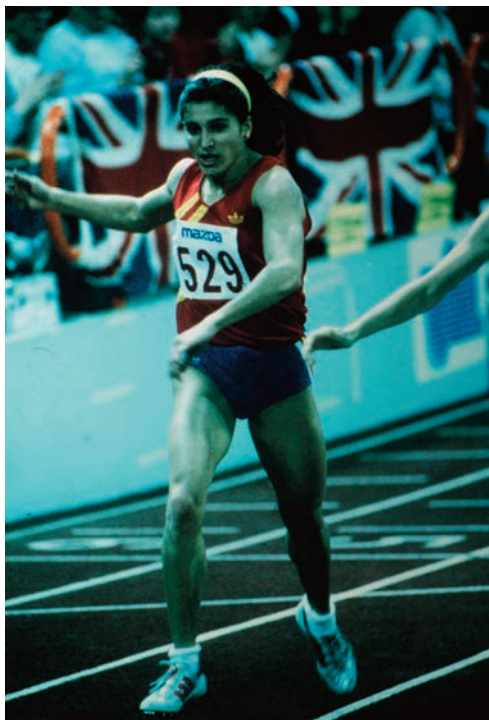
La canaria Cristina Pérez llega a meta en la final de 400m del Europeo de Liévin 1987 haciéndose con el bronce y el récord de España (52.63), mejorando su anterior plusmarca de 52.83 de la ronda eliminatoria del día anterior.