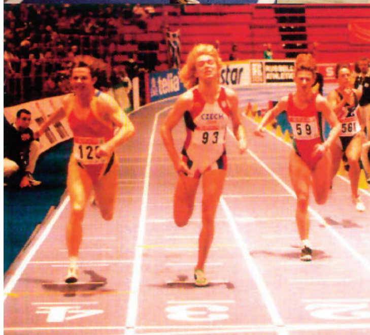
Myers (por la calle 4) proclamándose campeona de Europa en Estocolmo en 1996.