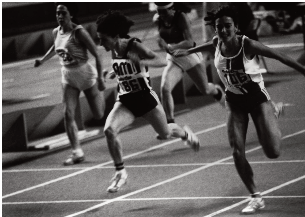
Hasta cinco plusmarcas españolas batió Teresa Rioné en 60m en 1985. Fue el gran año de la velocista catalana, olímpica el año anterior. Aquí la vemos en el Campeonato de España ganando la prueba ante Lourdes Valdor con una marca de 7.41.