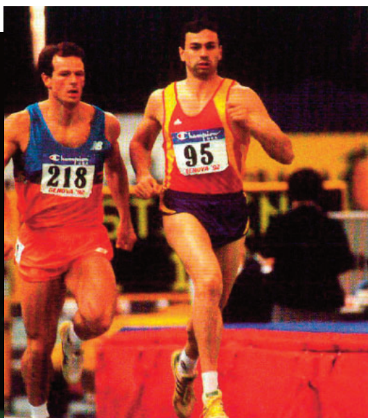
Antonio Peñalver, el atleta español que más plusmarcas acumula entre heptatlón y octatlón (5) entre 1988 y 1992. A la izquierda, en el encuentro 4N de combinadas celebrado en Zaragoza y a la derecha, en el Europeo de Génova de 1992.