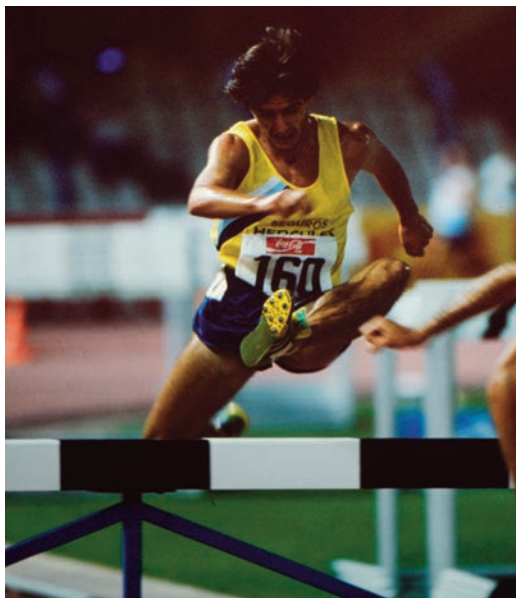
Jon Azqueta, en una prueba de exhibición en 1987 en San Sebastián, fue el primer español en saborear el 2.000m obstáculos bajo techo.