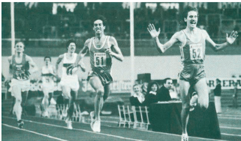
José Luis González y José Manuel Abascal fueron protagonistas absolutos en el Europeo de Milán en 1982: Oro y Plata y un récord para cada uno en 1.500m en la final y eliminatoria respectivamente.