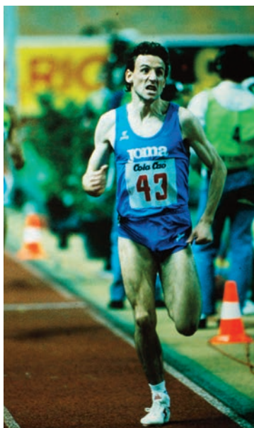
Un jovencísimo Fermín Cacho se asomaba en 1992, corriendo en la pista madrileña en 2.20.18.