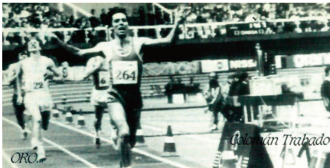
Colomán Trabado logrando holgadamente el título europeo y el récord de España (1.46.91) en el Europeo de Budapest en 1983.