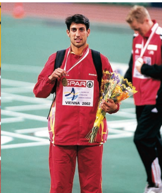
Antonio Manuel Reina tocó techo en el Europeo de Viena en 2002 con un récord (1.45.25) intocable hasta el día de hoy.