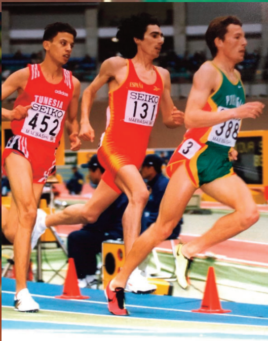
Andrés Díaz estuvo casi veintidós años como plusmarquista europeo de 1.500m con sus 3.33.32 que logró en El Pireo en 1999 semanas antes de su medalla de bronce en el Mundial de Maebashi (arriba se le ve por detrás del portugués Rui Silva).