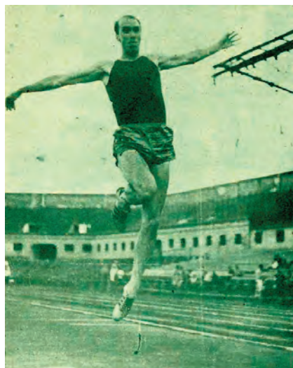
Luis Felipe Areta acumuló 21 records en la prueba de triple entre 1959 y 1968.