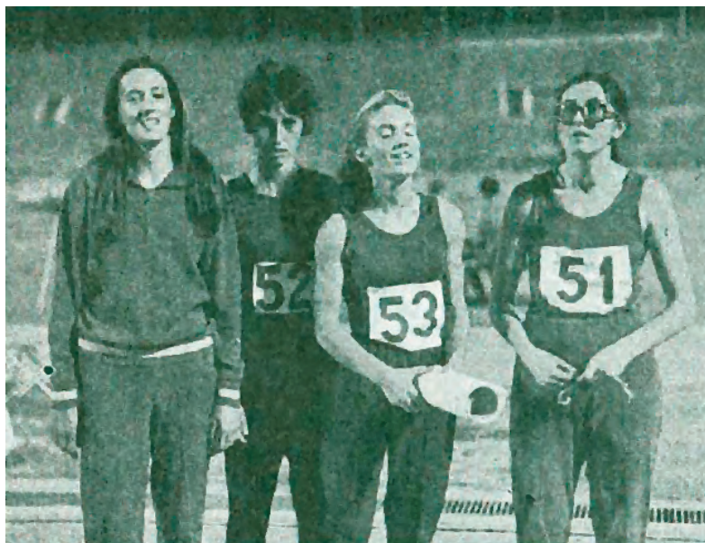
Equipo español que batió el record nacional con 48.9 en Atenas, en el encuentro contra Grecia.