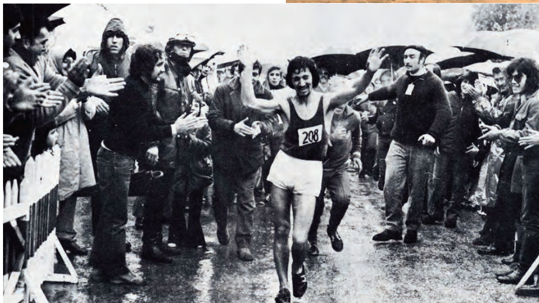
El granadino Víctor Campos marcó los inicios de la década de los 70 con una larga lista de récords en pista y ruta.