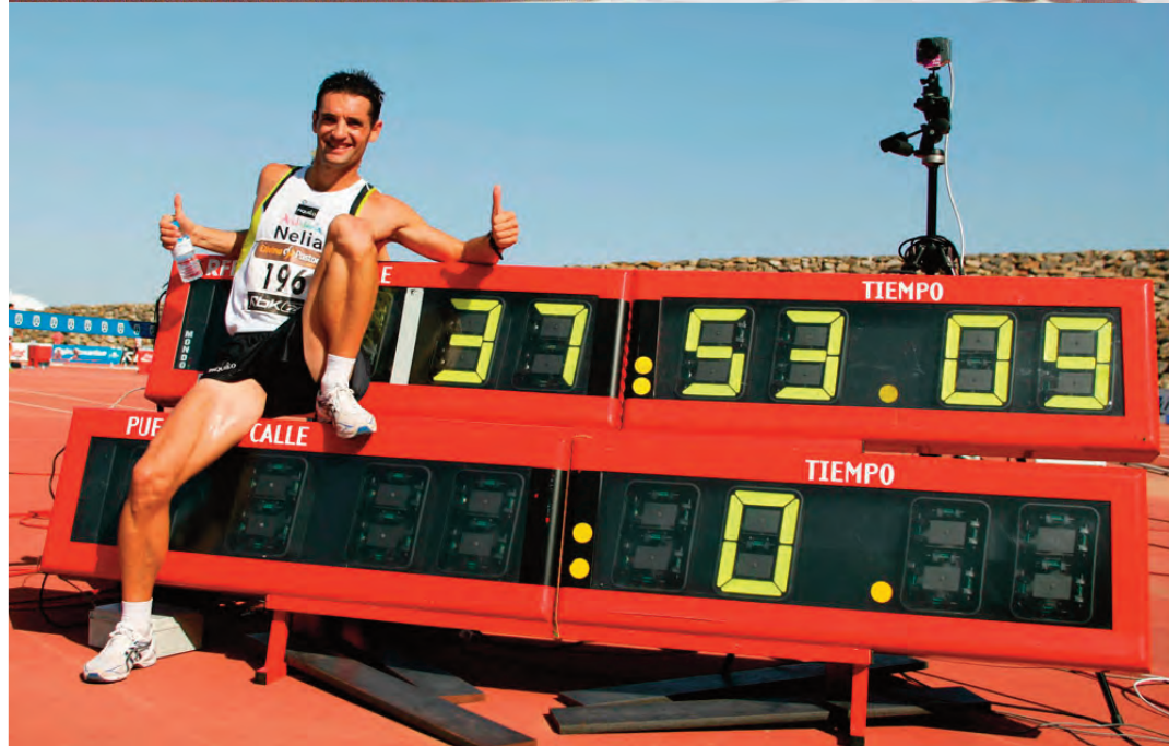
Paquillo Fernández batiendo dos récords del Mundo: arriba, el de 20km marcha en Turku en 2002 y abajo, el de 10.000m marcha en el Campeonato de España de 2008 disputado en Santa Cruz de Tenerife.