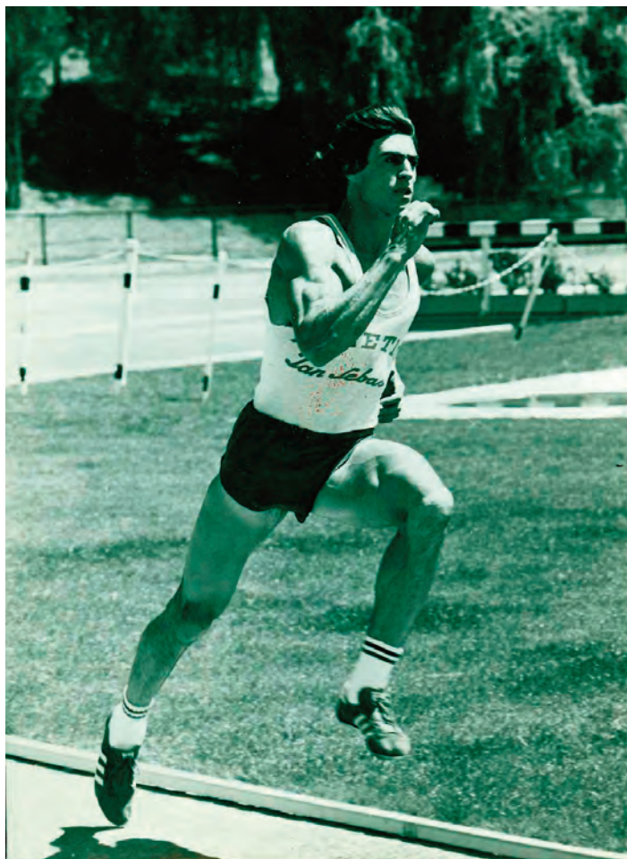
El navarro Jesús María Abadía acabó con la hegemonía de Rafael Cano en 1979 durante la Copa de Europa celebrada en Budapest donde realizó 7.344 puntos (eléctrico).