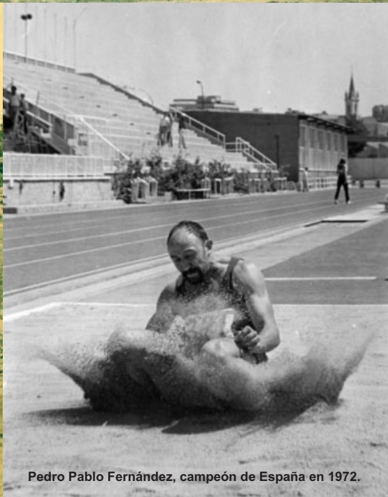
Pedro Pablo Fernández, campeón de España en 1972.