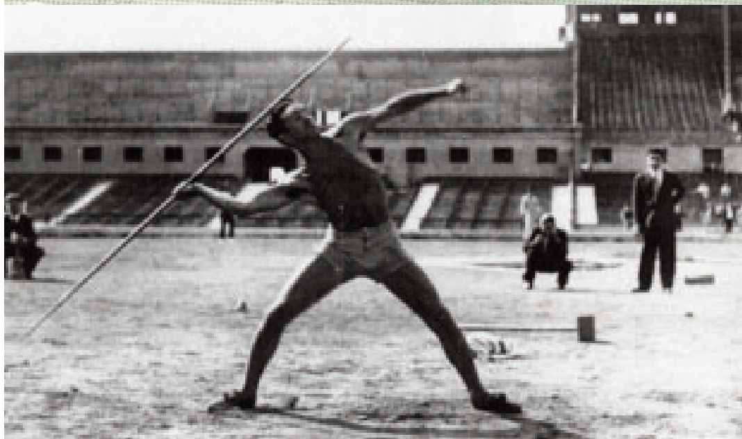
Luis Agostí, campeón España en 1932 en el estadio de Montjuic.