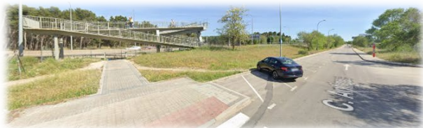
Puente para cruzar andando, calle Antiguo