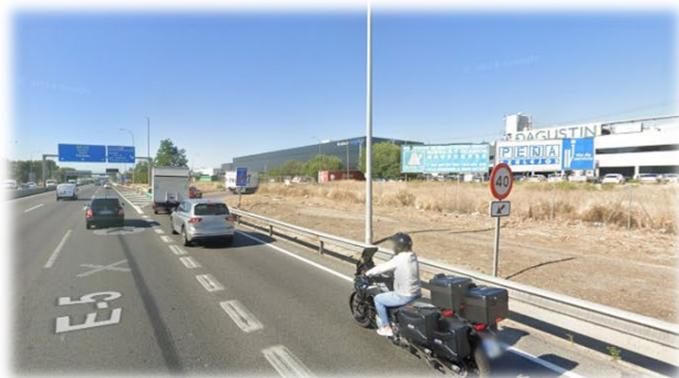
Tras pasar la gasolinera CEPSA, primera salida