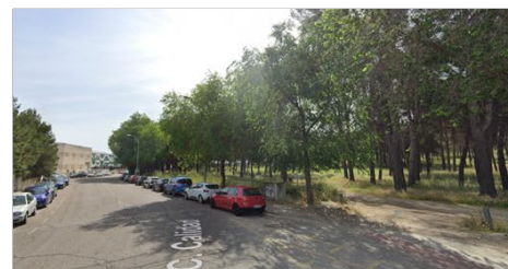
Acceso al cerro de los Angeles, calle Calidad