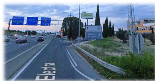
Tras pasar el cerro de los Angeles salida polígono Industrial Los Olivos